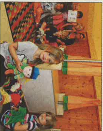
Die Elternbeiträge für die Kinderbetreuung steigen. In Horst (Bild rechts), Frielingen und Osterwald schließen zum 1. April die Volksbankfilialen. Das Wasser (großes Bild) wird für alle um 5 Cent pro Kubikmeter teurer.

■ In Sachen schnelles Internet sind Schloß Ricklinger Telekomkunden schon 2014 im Hochgeschwindigkeitszeitalter angekommen.