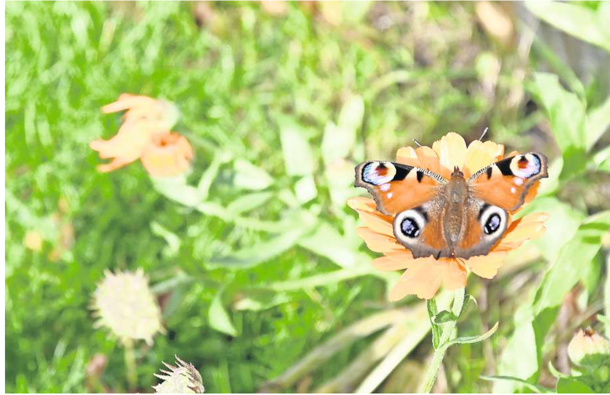
Noch Anfang November sind Tagpfauenaugen auf den Blüten von Ringelblumen zu beobachten.

sich ein geschärftes Bewusstsein für die Bedürfnisse von Raupe, Schmetterling und Co. beobachten. Wer es erträgt, dass ein oder zwei Kohlpflanzen als Raupennahrung dienen, kann sich im folgenden Jahr über Kohlweißling und andere Schmetterlinge freuen. Die Raupe des Jakobskreuzkrautbären ist auf das gelb blühende Jakobskreuzkraut angewiesen, und so geht es